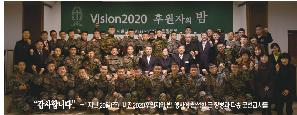
“감사합니다” - 지난 20일(주) '비전2020후원자의 밤' 행사에 참석한 군 장병과 파송 군선교사들

아직도 참여하지 못하신 성도님들께서 더 많은 후원과 기도로 동참해주실 것을 기도 드리며 성도님들의 가정과 사업 위에 삼십 배, 육십 배, 백 배의 하나님의 축복이 임하시길 기도 드립니다.