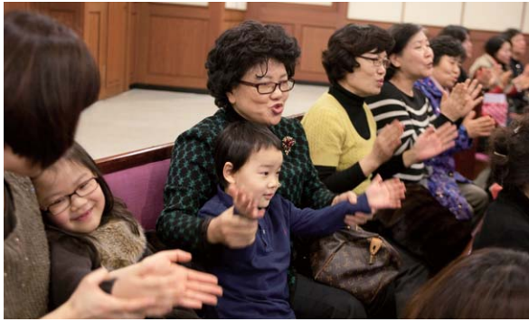
엄마랑~~~ 할머니랑~~~~ 예배 드려요!