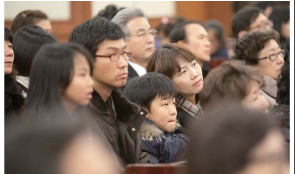
목사님 설교를 경청하며...