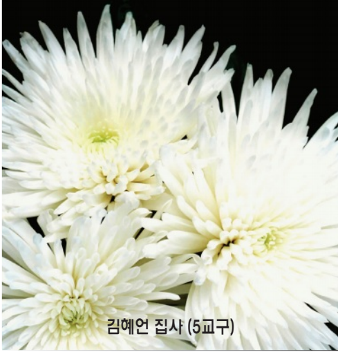
김예언 집사 (5교구)