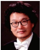
지 휘 유태왕 집사