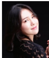
알토 장원아 성도