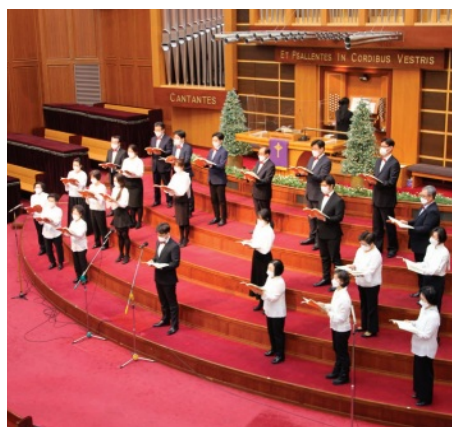
지난 주일 찬양예배 시 임마누엘찬양대의 성탄절 칸타타 '사랑의 왕' 연주가 있었다.