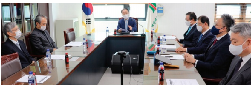
6월 21일(월) 총회 총회장실에서 열린 간담회

소송 취하에 따라 대법원에 계류 중이던 서울교회 안식년규정 관련 본안 사건은 서울교회가 승소한 판결 내용이 그대로 확정되어 한 국교계에 이정표를 제시하게 되었고, 또한 용역점거 손해배상 건도 그대로 확정되어 많은 분쟁 교회들에게 불법 용역을 동원한 대가가 얼마나 크고 쓰라린 결과를 초래한 것인지 귀한 교훈으로 남기는 결과를 얻었다. 아울러 박노철 목사에 대한 총회재판국 출교 판결도 국가법원에서 더는 변경 가능성 없이 확정 되는 결과도 얻었다.