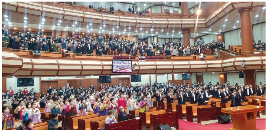
제15대 안수집사 제14대 권사 임직식