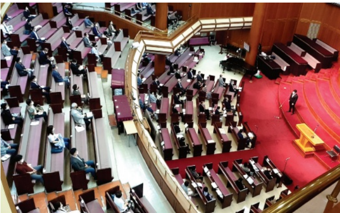
제15대 장로 선출을 위한 공동의회

교회 회복을 위하여 할 일 많은 서울교회에 신실하신 많은 주의 일꾼들이 세워질 수 있도록 은혜 내려주신 하나님께 감사드립니다.