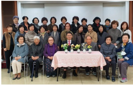
교회 802호에서 모임을 가진 2교구