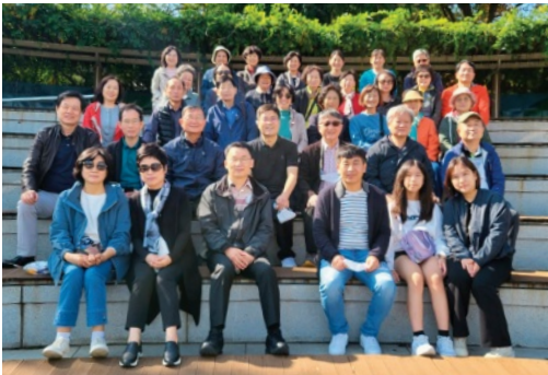
올림픽 공원에서 은혜로운 시간을 가진 4교구