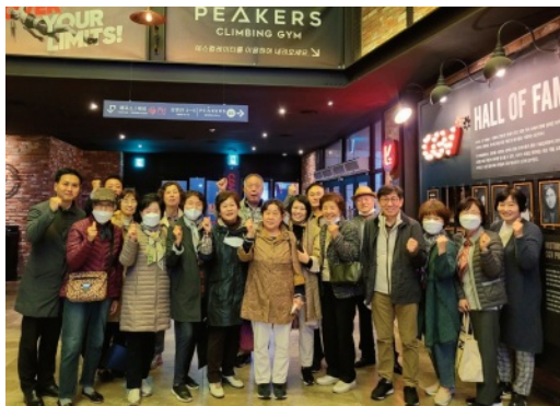
추억의 종로3가 피카디리 CGV극장을 찾은 8교구