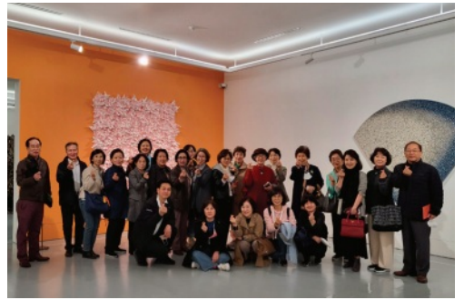
뮤지엄 그라운드에서 모인 3교구