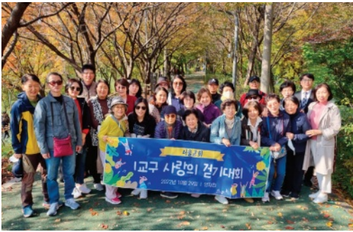
양재천 걷기대회를 진행한 1교구

지난 10월 10일(월) 8교구를 시작으로 한 달간 진행된 교구별 친교 모임이 은혜 중에 잘 마쳤습니다. 교회의 혼란한 시기를 기도와 믿음으로 잘 견뎌주시고 교회 회복을 위해 힘쓰신 모든 성도들을 위로하고 개편된 교구 식구들의 친교를 위해 진행된 교구별 친교 모임에 참여해 주신 모든 성도님들께 감사드리며 이런 귀한 자리를 마련해 주신 교회에도 감사드립니다.