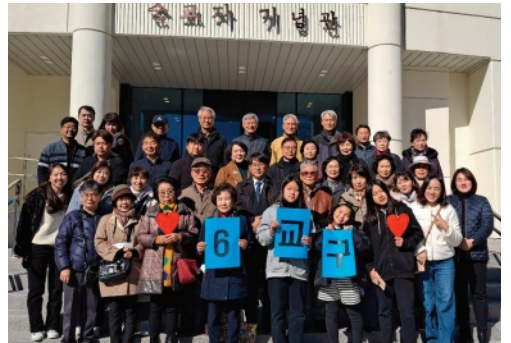
한국 기독교 순교자기념관을 찾은 6교구