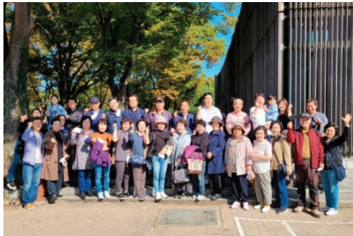
올림픽 공원에서 모임을 가진 5교구