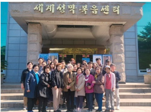
세계성막복음센터에서 모임을 가진 7교구