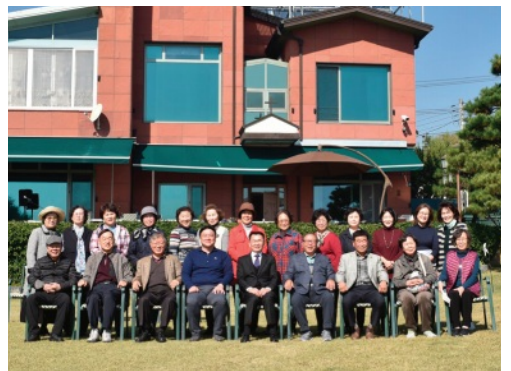
베델하우스에서 진행된 9교구 모임