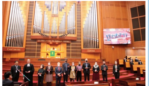
지난 주일 찬양예배 시간에 독일 비르템베르크 주 교회 루드비히스부르크 노회 노회장 (Ludwigsburg)과 독일 비르템베르크 주 교회 루드비히스부르크 노회 대표단이 우리 교회를 방문하였다.