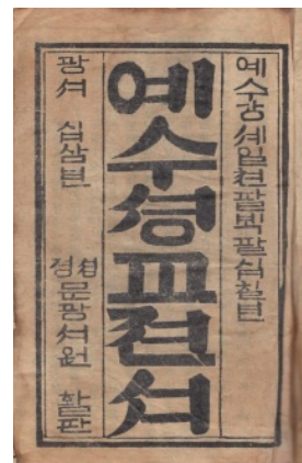
최초 한글 신약전서 예수성경전서