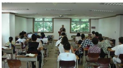
디아스포라부 여름수련회 (8.5~6)