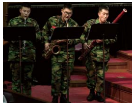
지난 주 찬양예배 후에 개최된 비전 2020 후원자의 밤 행사와 찬양예배 시 특송으로 하나님께 영광 돌린 참석자들