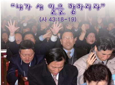
"내가 새 일을 행하리라" (사 43:18-19)

한국장로교총연합회(한장총)는 1월 31일(화) 오후 7시 우리교회 본당에서 한국장로교총회 설립 100주년 목사·장로 기도회를 개최한다. 이번 기도회는 한국장로교총회 설립 100주년을 맞아 한 교단 다체제 연합을 이루고, 한국교회와 사회에 희망을 주기 위함이며 장로교 지도자들인 목사, 장로 1200여 명이 모일 예정이다. 이날 설교는 우리 교회 이종운 원로목사가 담당 한다. 성도 여러분의 관심과 기도를 부탁드립니다.