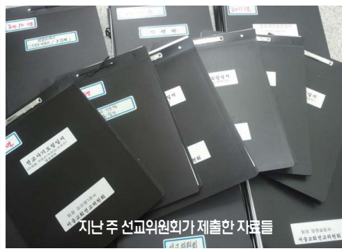
지난 주 선교위원회가 제출한 자료들

아울러 2010년 이전 과거 기록물도 보관중인 것이 있으면 반드시 함께 제출해주시기 바랍니다. 또, 컴퓨터 파일인 경우엔 서울교회 홈페이지내에 "기록물 보관실"로 들어오셔서 파일을 올려주시기 바랍니다. 파일 제목에는 부서명과 기록물의 이름, 담당자명을 써주시면 됩니다. (예: 초등부 회의록 홍길동) 제출해주시는 자료는 교회내 역사자료실에서 정리해 영구 보존할 예정입니다.