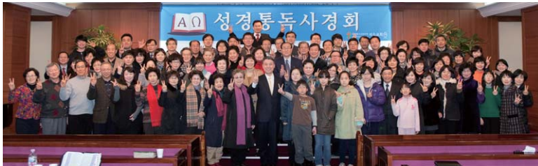
우리 교회는 설날 연휴인 24일(화) 오전8시부터 오후 5시까지 성경통독사경회로 모였다. 신약성경 사도행전 1장부터 요한계시록 22장까지와 마가복음을 읽는 은혜의 시간이었다.