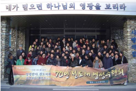
70인 전도대 영성수련회

받은 구원에 감사하여 한 영혼을 향하신 하나님 아버지의 마음을 품고 하나님 나라 확장을 위하여 사도 바울과 같이 받은 상급을 바라보며 생명 있는 그날까지 우리의 영혼을 쏟고 마음을 쏟으며 복음 전하는 일에 "죽도록 충성하라 그리하면 내가 생명의 면류관을 네게 주리라"라는 말씀을 묵상해 봅니다. 티끌과 같은 나를 충성된 자로 여기시고 복음의 도구로 삼으신 주님께 감사와 찬양과 영광을 돌립니다.