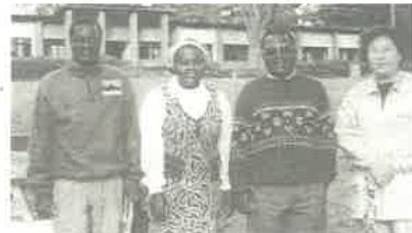
◀ 중앙 아프리카에서 사역하는 문명속 선교사 (오른쪽 끝)

가 나를 영화롭게 하나님!"(시 50:23) 강의 안을 많이 갱신하고 있습니다. 카메룬에서 행정적인 것들을 많이 맡다보니 강의가 많이 부실했던 것 같습니다. 방기 신학교에서 요청한 근대철학사 강의를 준비하면서 "르네상스와 종교개혁"의 관계에 대해 새롭게 눈을 뜨게 될것 주님께 감사하고 있습니다. 헬라 사상의 부활과 초대교회 사도들의 신앙