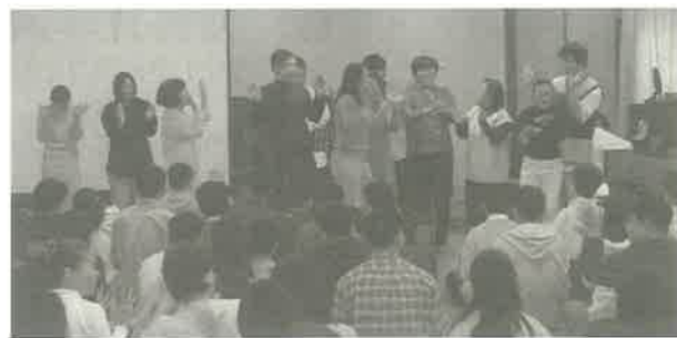
◀사랑부, 고등부연합예배 "나 남의 가진 것 비록 없으나..."