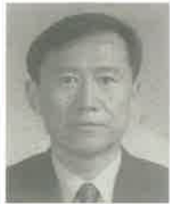
이태원 집사(중등부 부장)