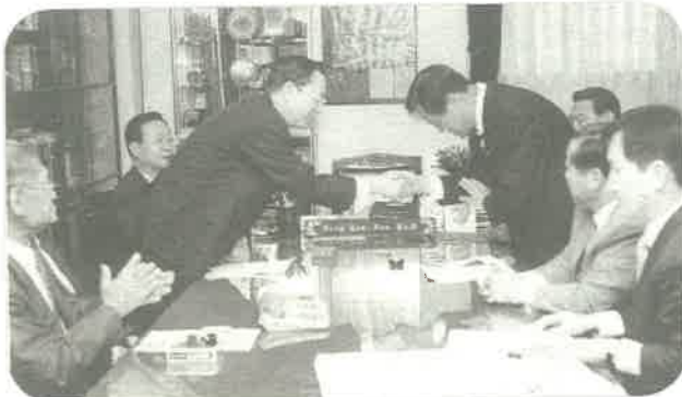
1998년 11월 2일 새예배당 건설공사를 위한 도급계약을 상상중임건설과 체결하며...

서울교회는 창립 9년여 만인 지난 2000년 12월 25일 성탄절에 감격스런 입당예배를 드리며 대치동 시대를 열었다. 그동안 논현동과 반포동을 거치며 일반 건물을 임대해 예배당으로 사용해오던 우리 교회는 처음으로 예배당을 새로 건축해 입당을 한 것이다.