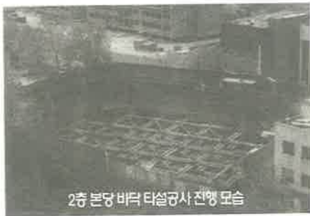
2층 본당 바닥 타일공사 진행 모습

다. 하지만 하나님은 큰 은혜를 베풀어주셨다. 대지가 결정된 직후인 95년 11월 5일 교회는 대지 구입비 100억 원을 목표로 전 교인이 건축헌금을 드렸다. 당시 당회원들은 건축헌금 작정을 앞두고 기도원에 들어가 금식하며 철야기도회를 가졌고, 전 교인들은 형편과 상관없이 옥합을 깨뜨리는 심정으로 너나없이 건축헌금을 드렸다. 이