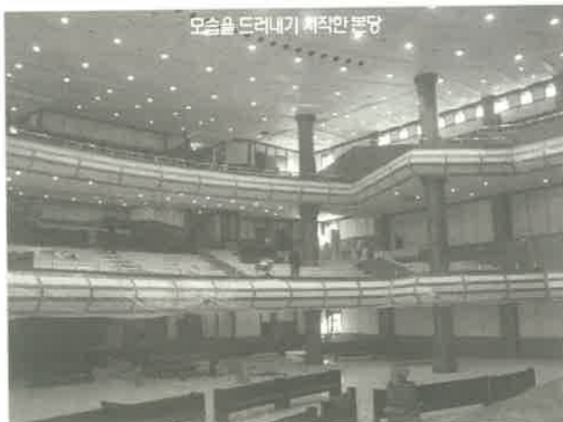
모습을 드러내기 직전 본당

다. 하지만 하나님은 큰 은혜를 베풀어주셨다. 대지가 결정된 직후인 95년 11월 5일 교회는 대지 구입비 100억 원을 목표로 전 교인이 건축헌금을 드렸다. 당시 당회원들은 건축헌금 작정을 앞두고 기도원에 들어가 금식하며 철야기도회를 가졌고, 전 교인들은 형편과 상관없이 옥합을 깨뜨리는 심정으로 너나없이 건축헌금을 드렸다. 이