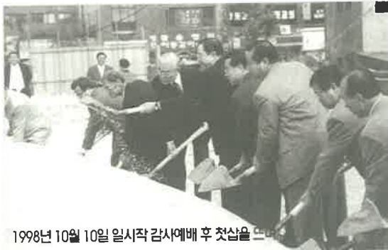
1998년 10월 10일 일시적 감사예배 후 첫삽을 드는 모습

교회는 창립된 지 3년 10개월만인 95년 9월 당회와 제직회에서 만장일치로 대치동 새 예배당 부지를 확정했다. 이 부지는 대치동 210번지로 강남의 아파트 밀집지역으로 지역전도의 영역이 넓고, 지하철 역 부근이어서 교통이 좋을 뿐만 아니라 6천여 평 규모의 공원이 바로 옆에 있어 환경도 쾌적했다. 그동안 수도권을 돌며 100여 군데나 봤던 예배당 부지 가운데 이렇게 좋은 조건을 갖춘 대지는 없었다. 이 땅은 그 당시에도 평당가가 천만 원을 훌쩍 넘던 땅이었다. 교회 재정 여건상 구입이 결코 쉽지는 않았