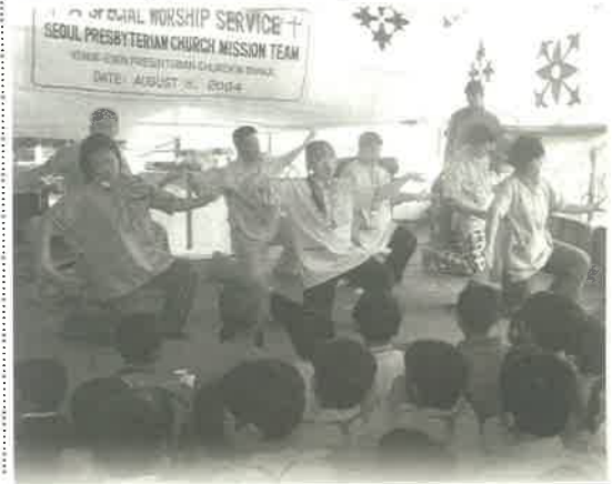
단기선교팀의 사역과 헌신을 위해 본명과 지역 명을 밝히지 않는다.

대학부에 오자마자 신앙이 깊은 많은 선배들을 보고 나도 저렇게 깊은 신앙을 갖고 싶다는 생각을 했었지만 나는 그에 따른 아무런 노력도 하지 않았습니다. 하나님은 내가 원하는 것을 당장이라도 주실 수 있으신 분이지만 먼저 우리의 헌신과 순종을 원하십니다. 나는 만약에 내가 그 때 태국단기선교 사로서서 결정을 내리지 않았다면 내 삶이 어땠는지 가끔 생각해봅니다. 우리의 작은 결정과 헌신에 따른 하나님의 은혜와 상급은 이 세상의 그 어떤 것과도 바꾸고 싶지 않고 그 어떤 말로도 완전히 표현할 수 없습니다.