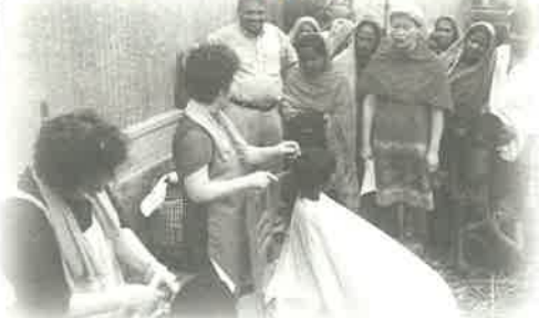
▶ 2004년 방글라데시에서의 봉사