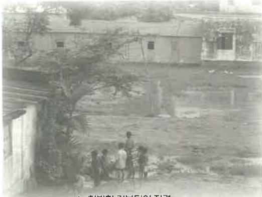
▶ 척박한 캄보디아 전경