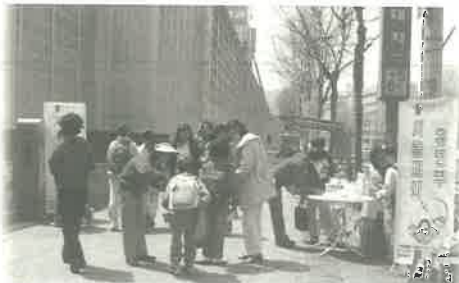
▶ 수요일 노방전도를 하는 유년부 교사들

마땅히 행할 길을 아이에게 가르치지 않으면 이단이, 불교가, 원불교가 먼저 점령해 버린다. 생명이 없는 이들도 생