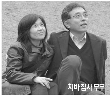
치바 집사 부부

그는 현재 일본 성결신학교에서 신학을 공부한 부인과 함께 이종윤 목사의 저서를 번역하고 있다. 슬하에 대학생인 1남 1녀가 있다.