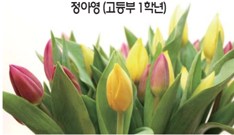
정아영 (고등부 1학년)

“아영아, 순결 서약식 이제 해야 될 때가 된 것 같아!” 고등부 시간에 나는 이 말을 듣고 놀랐다. 내가 삼남매중 막내여서 그런지 내가 아직 어린애라고 생각했었는데 이 말을 듣고 내가 벌써 곧 있으면 어른이 된다는 상황이라는 것을 느끼게 되었다. 뭔가 기분이 어색하고 설명할 수 없는 이상한 기분이 들었다.