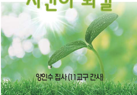
양인수 집사 (11교구 간사)

저희 11교구의 한 마음 한 가족 잔치는 6월2일(토) 10시에 시작하여 오후 3시에 마칠 예정입니다. 송파구 단일 행정구역으로 구성된 11교구는 교구식구들의 많은 참여를 위해 장소를 가까운 미사리 경정공원으로 마련하고 늦잠을 자고도 참여할 수 있도록 10시에 시작하여 오후 시간을 또 편히 쉴 수 있도록 오후 3시에 모든 일정을 마치려 합니다.