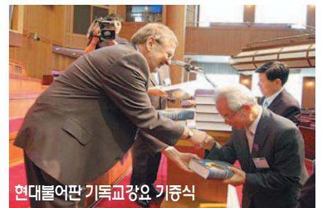
현대불어판 기독교강요 기증식