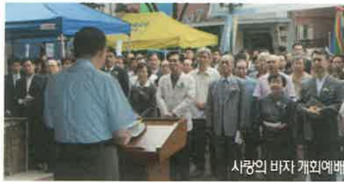
사랑의 바자 개최예배

이번 바자에는 너무 많은 성도님들이 수고하셨습니다. 오래 전부터 준비해온 바자위원회 각 임원들과 각 교구장 장로님들과 교구간사, 교구식구, 비가 오는데도 불구하고 하나라도 더 팔려고 힘쓰시는 성도님들, 열악한 환기상태 가운데서도 땀을 흘리시면서 음식을 준비하시는 성도님들, 재정위원과 사무국직원들, 특히 직장에서 때아닌 휴가를