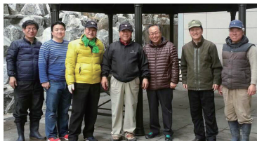
지난 20일(목) 비가 오는 중에도 아가페타운의 방수 공사를 진행한 작은 손길들...