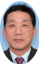
예안식 집사 (바자판매관리부)

불우이웃 및 탈북난민돕기, 동남아와 아프리카의 우물과기, 살리당 후원 및 중앙아시아 선교 지원을 목표로 이웃과 함께 하는 2014 사랑의 바자를 기도로 준비하고 있습니다.